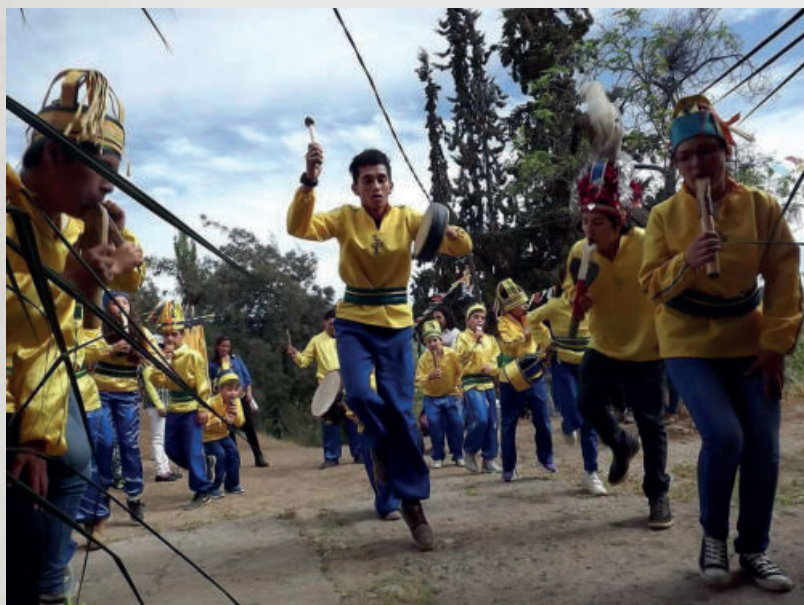
Baile Chino Adoratorio Cerro Mercacha entrando al Templo de San Miguel. San Esteban. Octubre de 2017. Autor: Elías Arriaza. Cedida por Mario Martínez Leiva.

“El baile chino no pierde –a pesar de todos los años– no pierde la parte ceremonial, en el sentido que los chamanes, para poder conectarse ellos siempre usaban hierbas para llegar a un éxtasis... Y está comprobado científicamente que cuando uno toca la flauta hiperventilando, estás soplando y aparte estás haciendo una actividad física con ritmo, sin parar, entonces el cansancio que tú tienes de repente se supera y ya no tienes cansancio, y sigues, y sigues, y sigues... Cuando yo fui flautista, llegábamos a saltar una hora y media, nosotros no la sentíamos, y de repente íbamos a hacer nuevas mudanzas y era práctica. Había mudanzas de tres tiempos, de cuatro tiempos, agacharse y había que coordinar... El tamborero es el que marca, y después todos siguen al mismo ritmo y eso solamente se consigue con ensayo”.