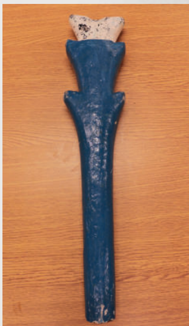
Flauta puntera azul-blanca elaborada en 1960 aproximadamente y se utilizó hasta los años setenta. La flauta puntera es la que se utiliza al inicio de la fila y el chino puntero está a cargo de llevar el ritmo. La flauta fue elaborada a mano y es una sola pieza de madera. *

* Autor de las dos fotografías: Felipe Arriagada. Ceditas por Lorena Jorquera del Baile Chino Cruz de Mayo Los Chacayes.