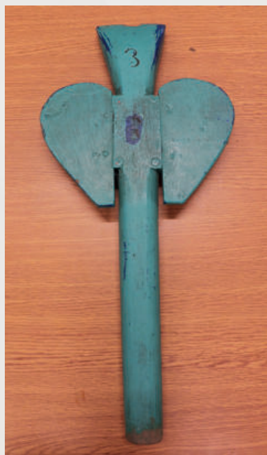
Flauta puntera verde. Esta flauta fue elaborada aproximadamente en 1978 y se utiliza hasta hoy día. *

“Todos tienen su rol. Por ejemplo, el puntero, fuera de salir con un ordenamiento del sonido y el otro responder el sonido, también tiene que ver con la disciplina de la fila, las filas derechas, no es que pare de tocar las flautas, sino que lo mira no más, o el de tres o cuatro más allá está tocando mal, y no hay para que hablar, con gesto o sonidos es suficiente, para alinear y armonizar el sonido con el que corresponde”.